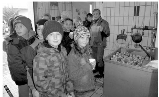
Klassen 4a und 4b im Mosthaus