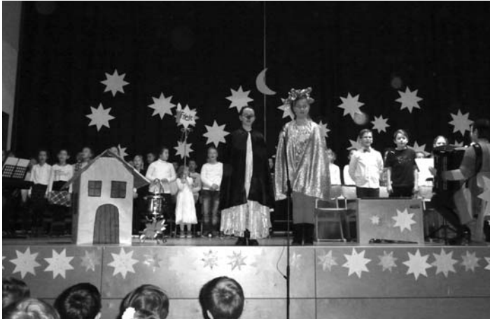
Minimusical „Das Täubchen des Friedens“

tatkräftige Unterstützung beim Auf- und Abbau sowie den Proben. Ein weiterer Dank geht auch an den Elternbeirat für die kulinarischen Genüsse.