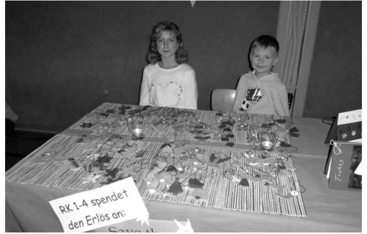
Selbst gebastelte Anhänger zum Verkauf der katholischen Religionsgruppe der Grundschule

Wir wünschen allen fröhliche Weihnachten und ein gesundes Neues Jahr!