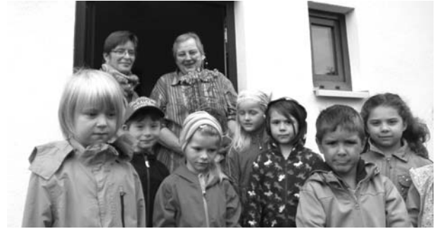
Kinder, Eltern und Kita-Team „Waldmäuse“